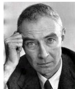
Julius Robert Oppenheimer, direttore scientifico del progetto Manhattan